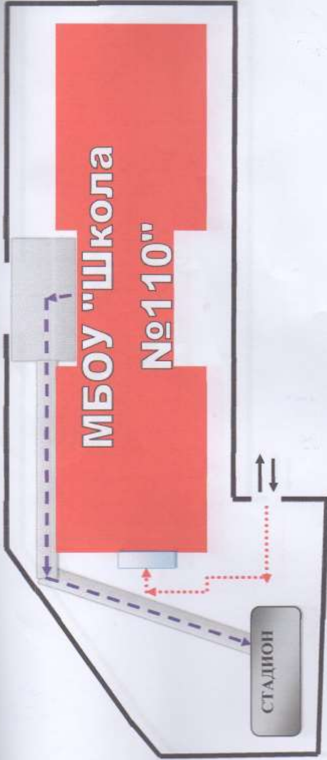
2. Маршруты движения организованных групп детей в стадиону.

Въезд/выезд грузовых транспортных средств